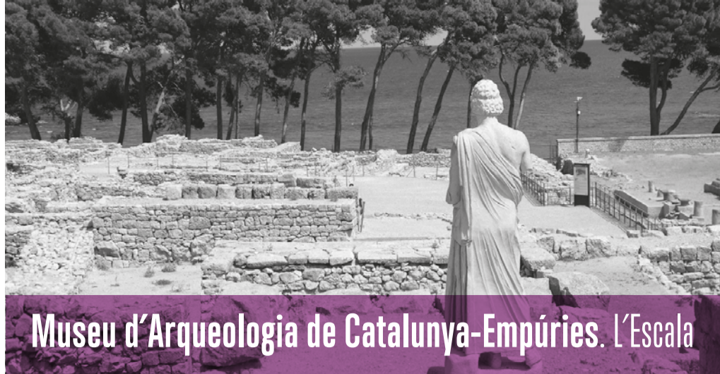
Museu d'Arqueologia de Catalunya-Empúries. L'Escala